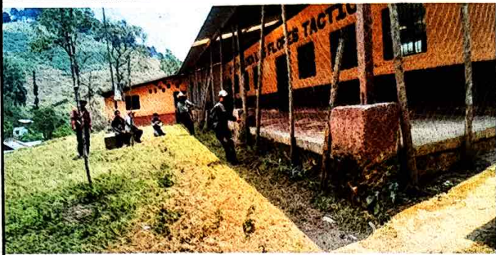
Foto1: Sustitución de cerco perimetral.